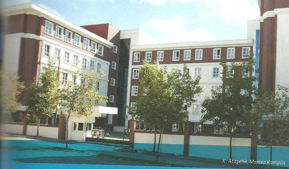
K. Ataşehir, Merkez Kampüsü